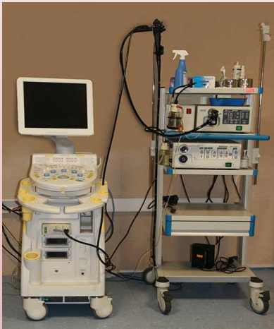
تهیه و تنظیم:

گروه آموزش به بیمار و ارتقای سلامت بیمارستان مهراد